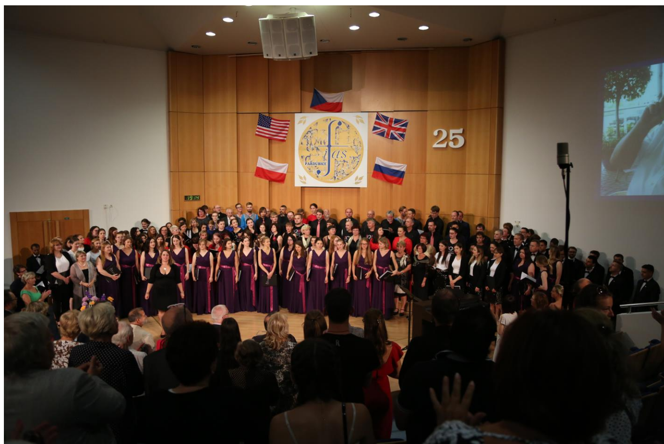
Mezinárodní sbor IFAS 2018

Na festivalu vystoupilo 10 sborů z ČR, Polska a Ruska.