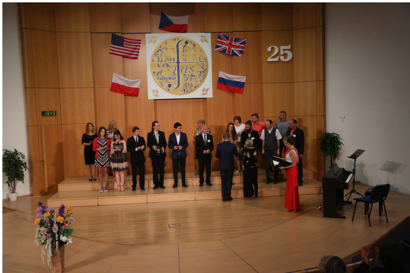
Realizační štáb IFAS 2018

Při samotné realizaci festivalu se štáb rozšířil o 25 dalších dobrovolných pracovníků, kteří se v průběhu festivalu starali o bezproblémový průběh všech koncertů a soutěží.